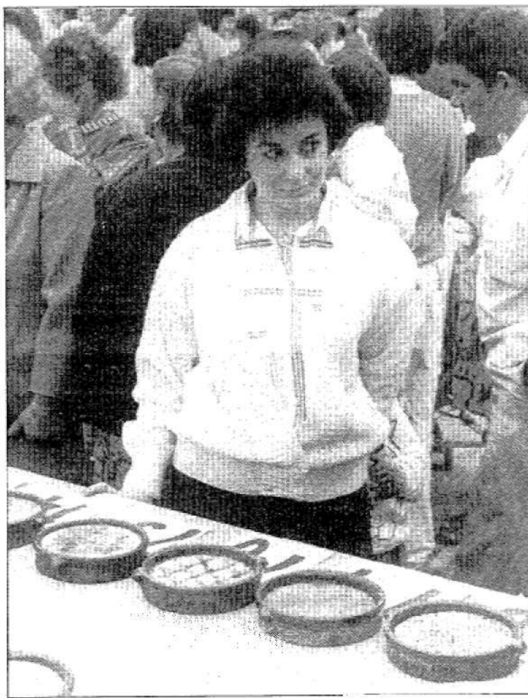
Una joven contempla algunas de las tarrinas presentadas en otra edición.