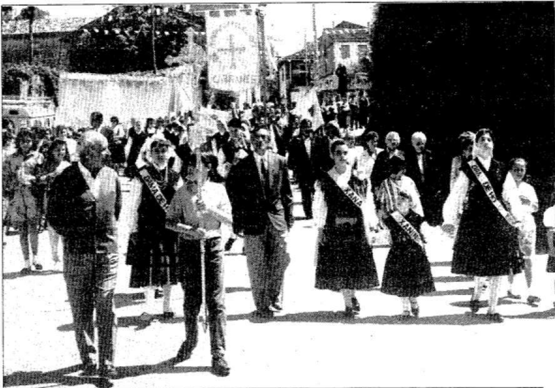
El paseo del santo, «xanas», gastronomía, folclor, deporte y todo tipo de alicientes aguardan al visitante, este fin de semana, en Cabranes.

El fallo del concurso del arroz con leche se dará a conocer a la una de la tarde de mañana, domingo, desde el quiosco de la plaza del Emigrante, pedazo de suelo local así llamado en homenaje a cuantos hubieron de irse del concejo.