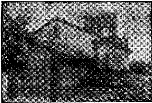
SAN SALVADOR DE FUENTES

Pasaba por los de Priesca, Fuentes y Valdediós, junto con los monasterios intermedios dedicados a Santa María