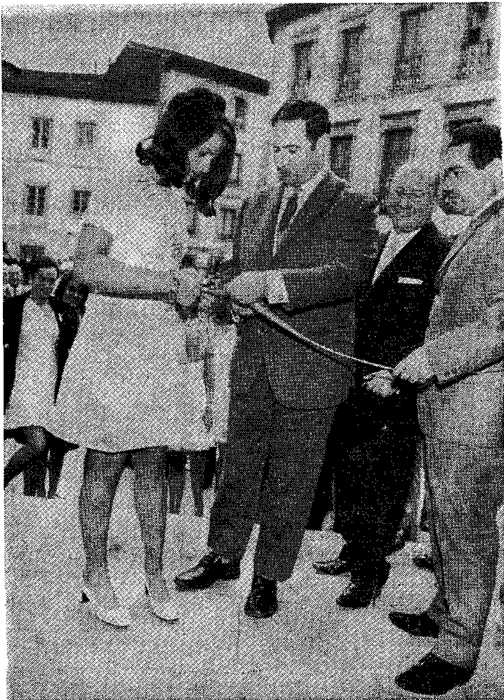
Reina y damas de honor con el alcalde de Villaviciosa