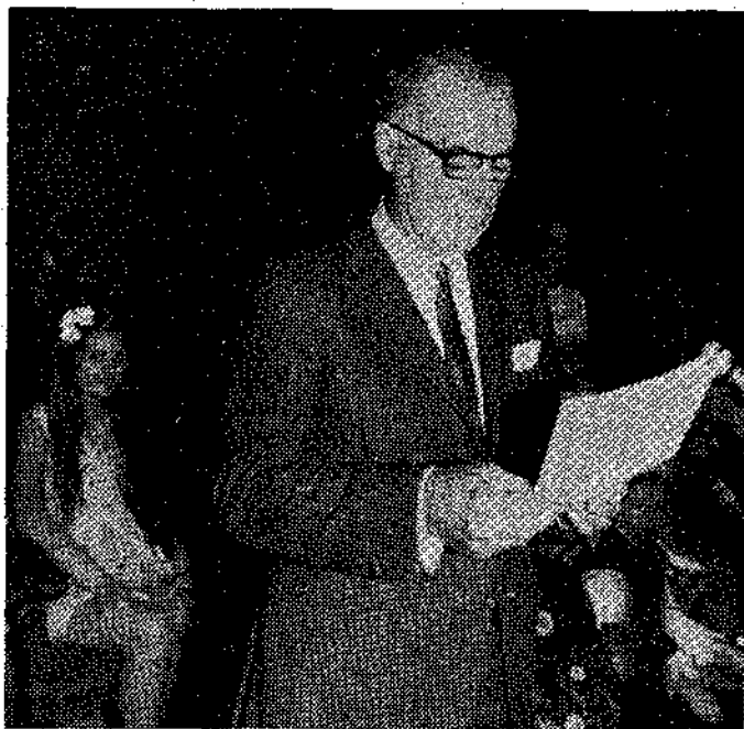
El alcalde de Oviedo pronunciando el pregón

Villaviciosa.—(De nuestro corresponsal, Bernardo GONZALEZ).