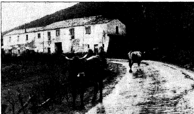
Los Oscos y la comarca del Eo tendrán en el futuro un plan para superar sus desigualdades económicas

Los municipios que están comprendidos en el programa de desarrollo integral son los de Castropol, Vegadeo, San Tirso de Abres, Taramundi, San Martín de Oscos, Santa Eulalia de Oscos y Villanueva de Oscos. «Presupuesto básico para la realización del programa, su seguimiento y ejecución, es la configuración de los órganos que lo tendrán encomendado», se asegura en el decreto de la Consejería de Agricultura. Estos órganos serán un comité de coordinación y la gerencia.