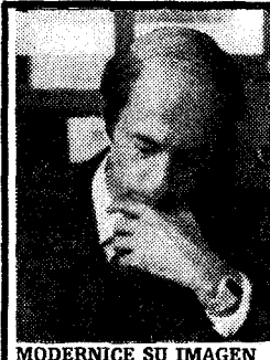
MODERNICE SU IMAGEN

El día 22 de agosto, a las 6 de la tarde, subasta de puestos y barraca de las fiestas de ROCES, GIJÓN Del 5 al 8 de septiembre