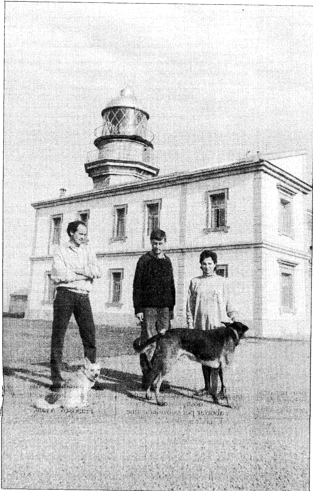
Los tres jóvenes técnicos de señales marítimas del faro de Peñas afirman sentirse satisfechos de su trabajo y disfrutar con la tranquila vida que llevan.