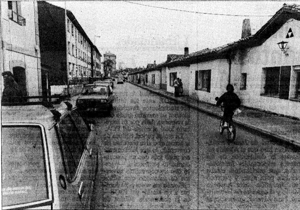
La calle Rosales, arteria principal de un barrio donde las vías tienen nombres de flores.