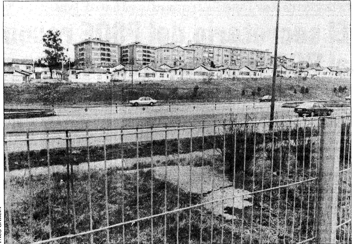
La construcción de la autopista partió al barrio en dos zonas.