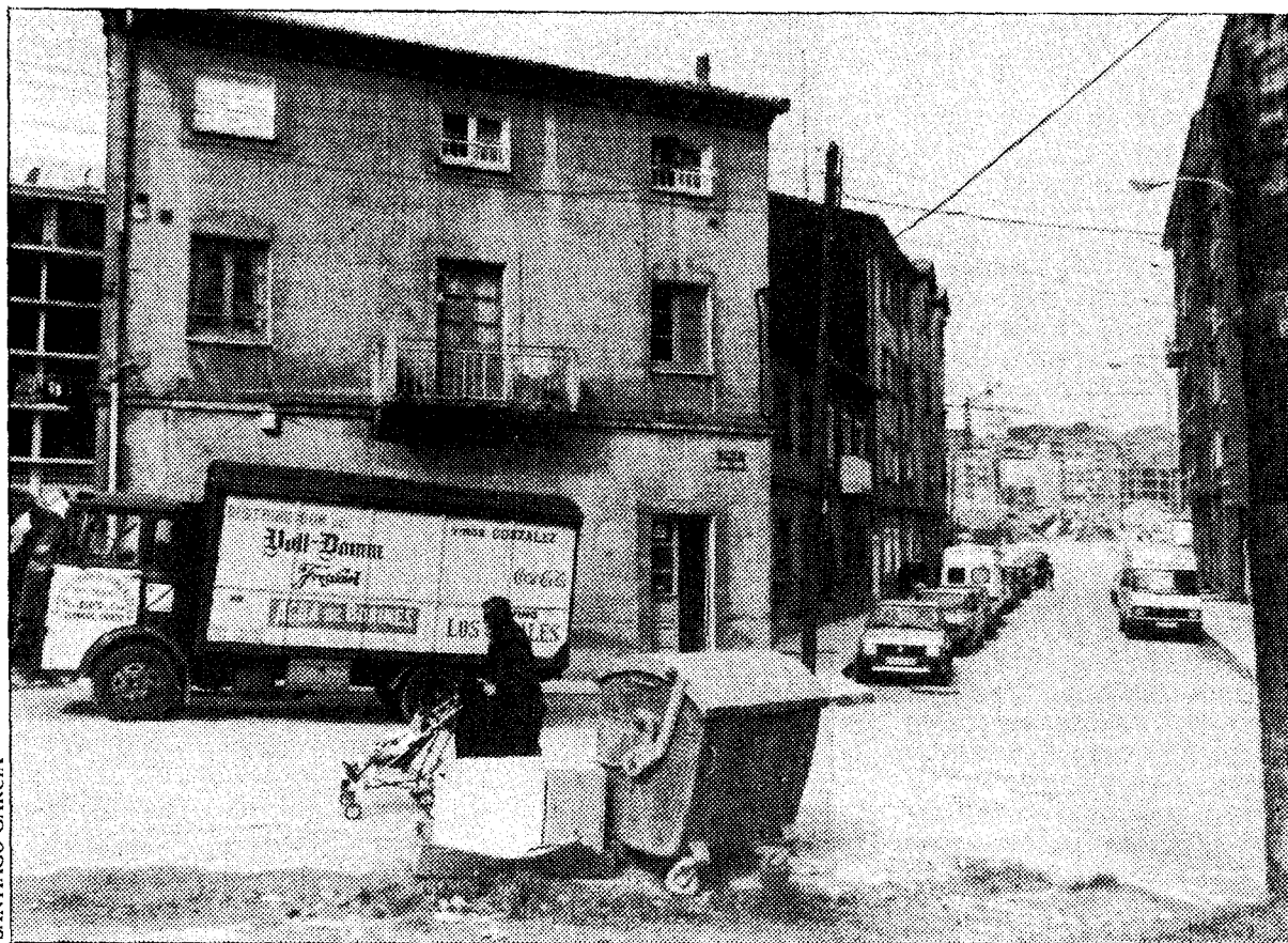
La mayor parte de los vecinos de La Florida afectados por el plan vive en casas modestas y cuenta con bajos ingresos.

Según manifiestan los vecinos, el problema de La Florida es de antiguo. «Desde 1970, somos víctimas de una falta de política urbanística coherente», comenta Avelino Suárez, vecino de la calle Alfonso I. «En ese momento se aprobó el plan parcial de La Florida, para efectuar el realojamiento de una amplia zona del noroeste de Oviedo. Ese plan, se dejaban fuera de planificación cientos de vivien-