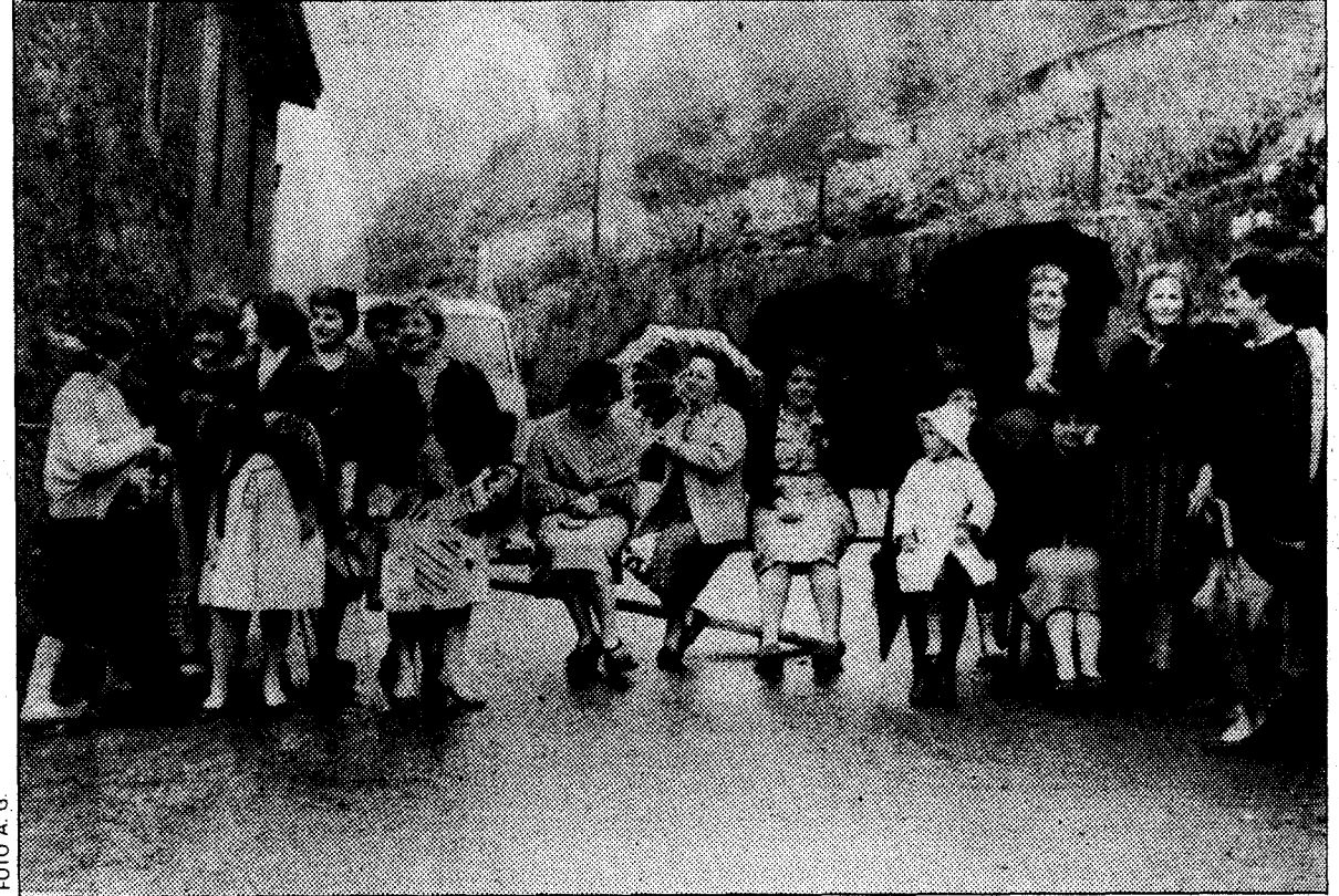
Las mujeres en plena carretera de acceso al pozo «San Nicolás»

Por su parte, el alcalde, Eugenio Carbajal, aseguró que no