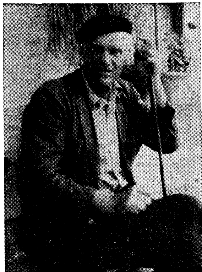
Alcalde de Boo: «El mayor problema que tenemos es la escasez de agua»

Le dicen al viajero que Boo tiene un buen alumbrado público. Pero el alcalde acaba de pedir un par de focos de luz para la entrada del pueblo. Cae la tarde y la plaza de Boo está inundada de niños que juegan y algunos parroquianos de los bares están sentados delante de los establecimientos tomando el vasín.