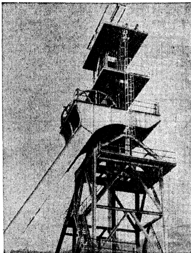
En el pozo «San Antonio», de Moreda, trabajan gran parte de los mineros de Boo