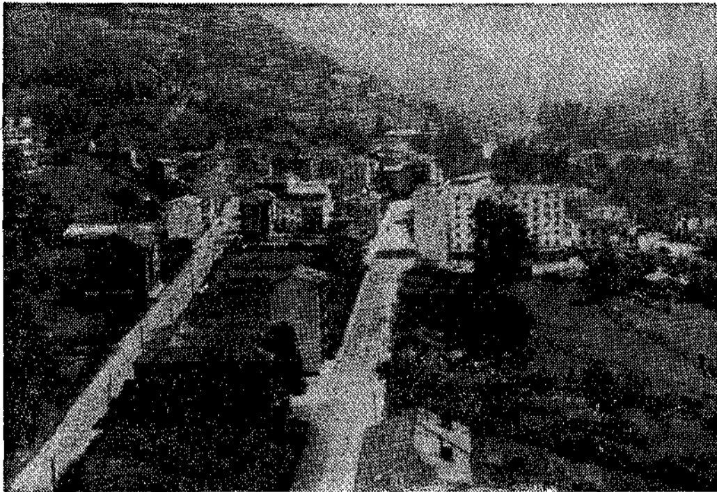
Cabañaquinta, que celebra el día 26 el mercadón.