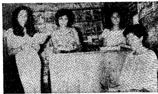
Candás.—Señoritas que atienden la Oficina Municipal de Turismo.

Su reproducción está prohibida. Lo que debería estar prohibida es su producción, y pienso que la editora ovetense, siempre captando lo más sorprendente a través de su buena técnica, se habrá dado cuenta de que su nueva postal no es de las afortunadas.