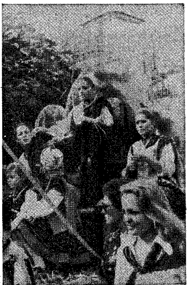
Reina y damas de la fiesta.

Por la tarde vendría el desfile de carrozas (ocho, en total) que partió del barrio de La Peruyal y terminó en el