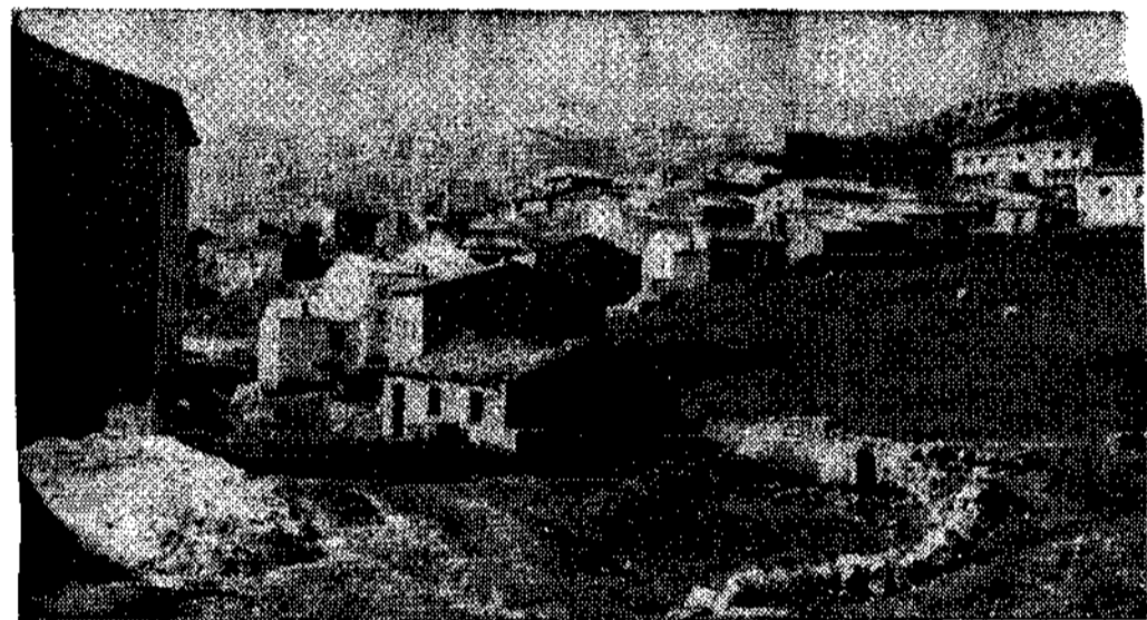
Una vista parcial del pueblo de Sotres, en Picos de Europa. Sin luz eléctrica y teléfono. Ahora, la Diputación Provincial de Asturias terminó de acondicionar (falta señalización) magníficamente su carretera de acceso desde puente Poncedos