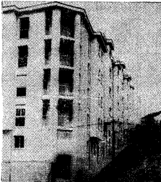
El nuevo grupo "San Marcos"

Con motivo del 18 de julio, tuvo lugar, en Navia, el acto de bendición e inauguración del nuevo grupo de viviendas