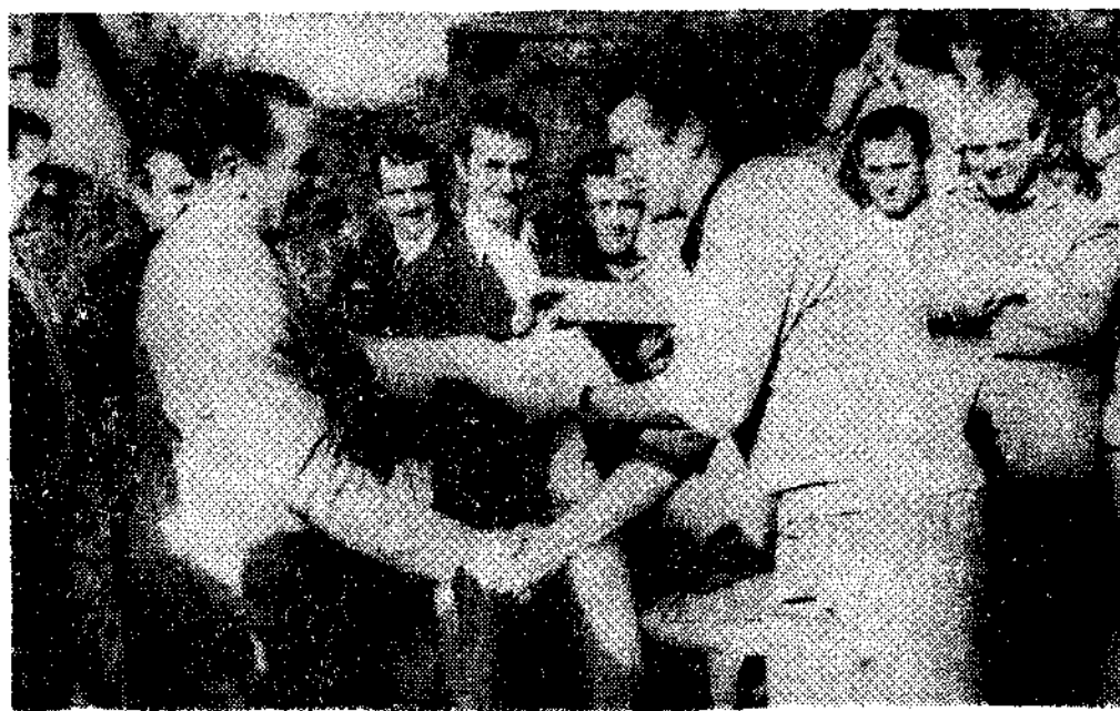
El alcalde entrega el título a uno de los beneficiarios.

(De nuestro corresponsal, SANCHEZ ABELLA.)