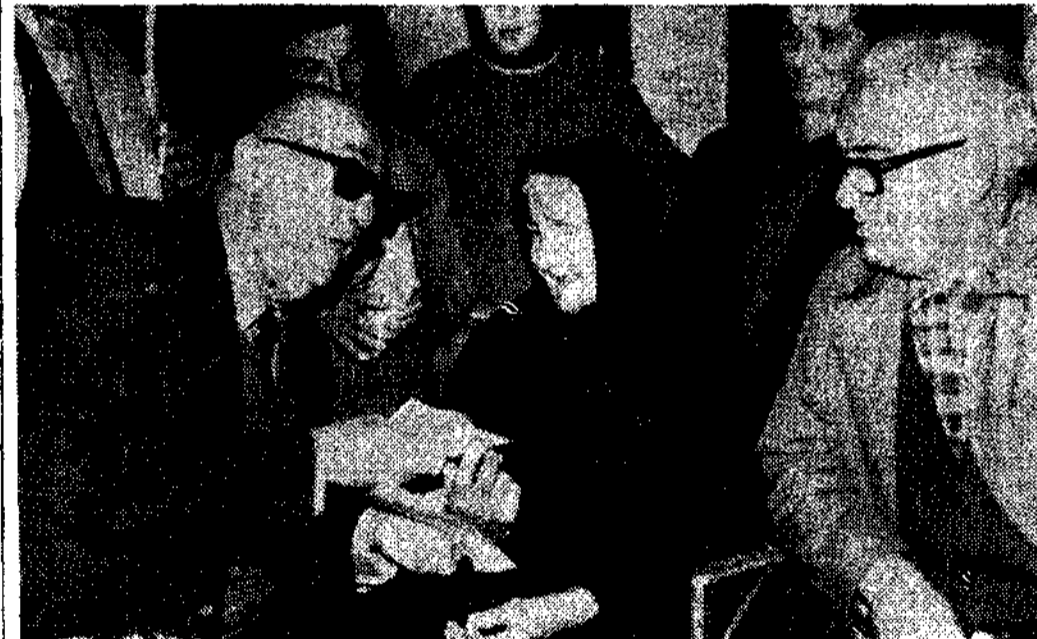
En primer plano, el señor alcalde haciendo entrega a la centenaria abuela de Asturias, del dinero; a la derecha, el concejal señor Campillo, y al fondo, dos hijas y un bisnieto de Esperanza

Cangas de Onís. -- (De nuestro corresponsal interino, R. A. PRADA).