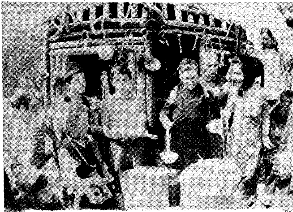
Pastores de los Picos de Europa demostrarán el proceso de elaboración del queso de Cabrales

En el año 1970, el certamen del queso de Cabrales hace su acto de presencia en la Feria