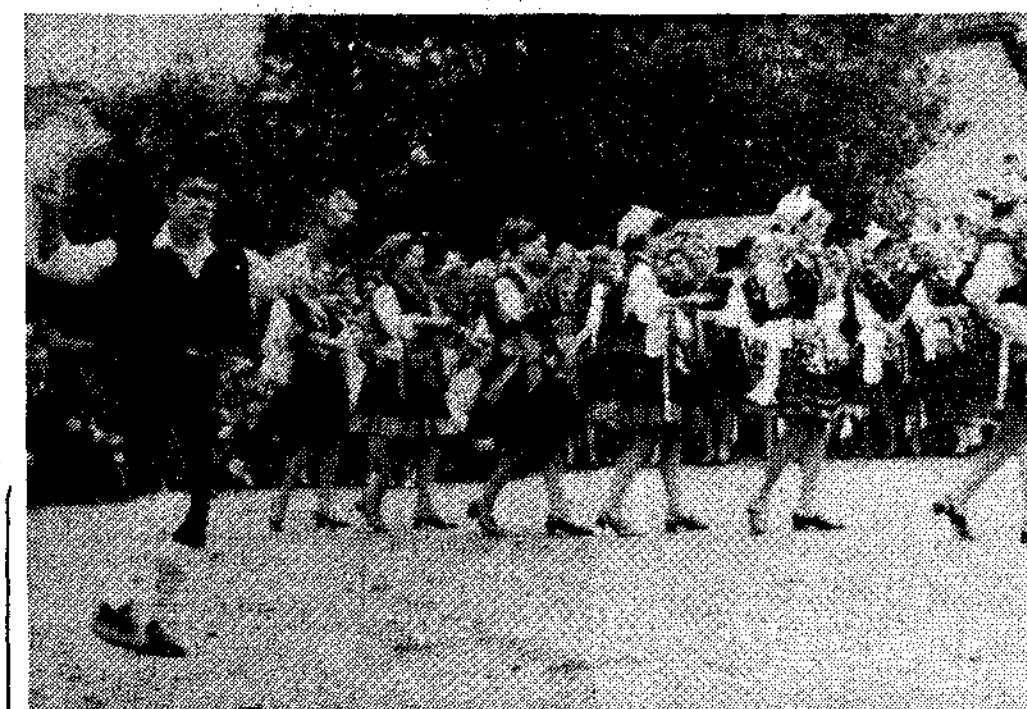
El corri-corri, la danza ancestral que se conserva con toda su pureza en Arenas