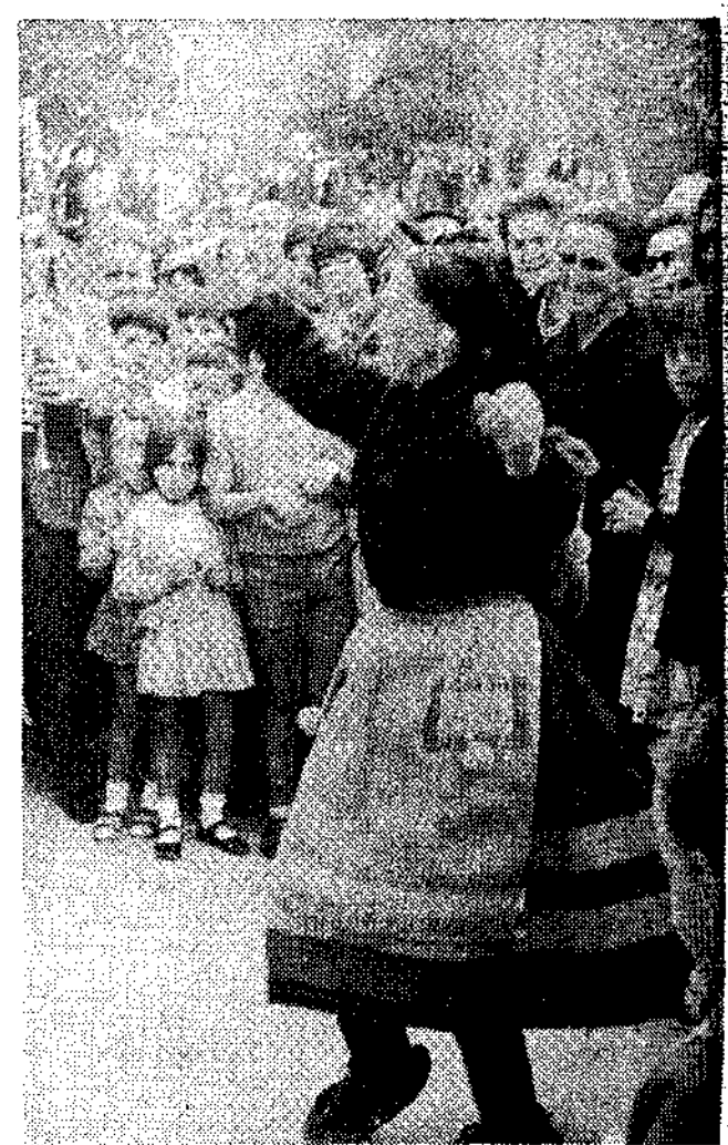
Los pastores cantan y bailan. Han dejado las majadas porque hoy es su fiesta