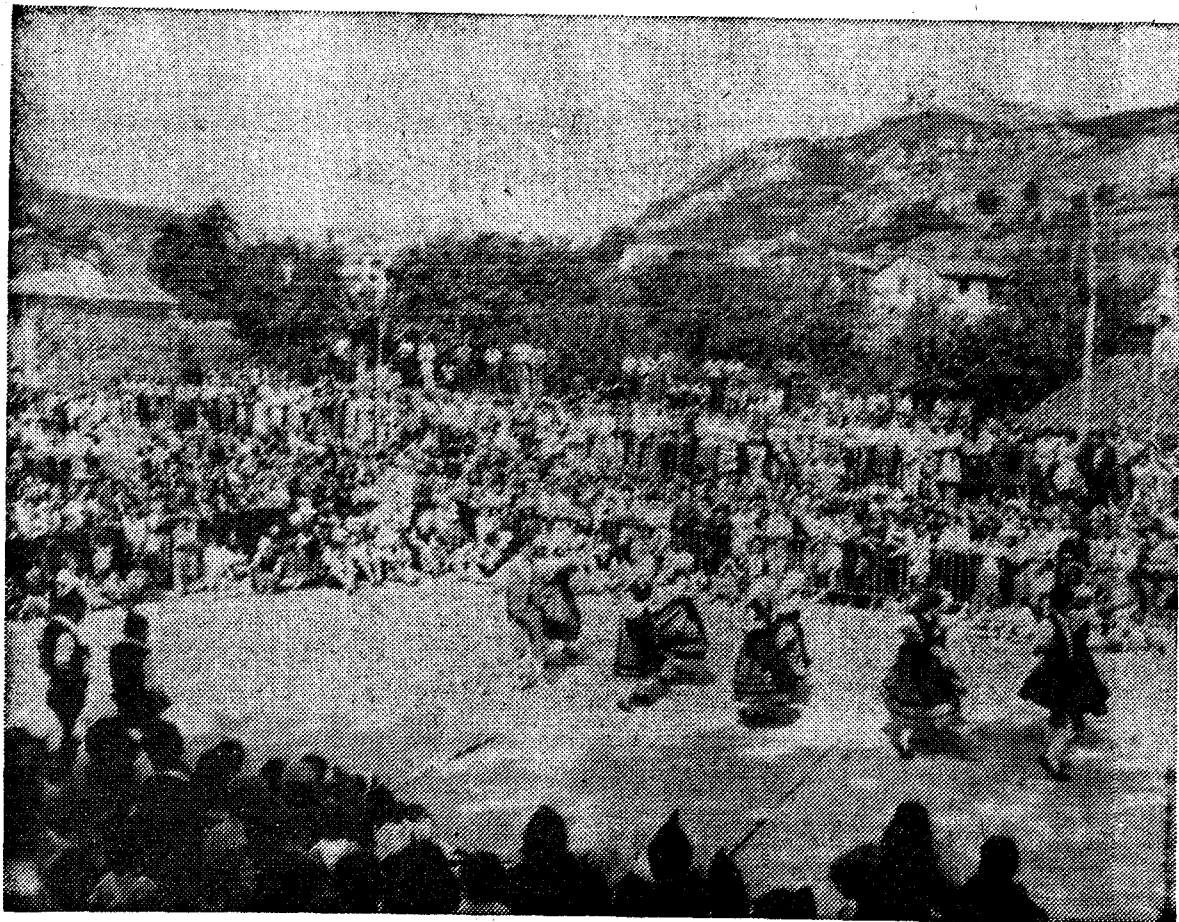
Miles de personas acudieron a Arenas el domingo