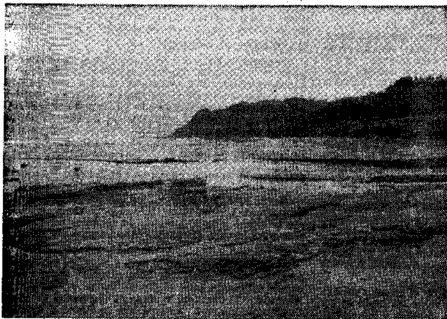
Playa de Colunga

Reportaje de EVA.