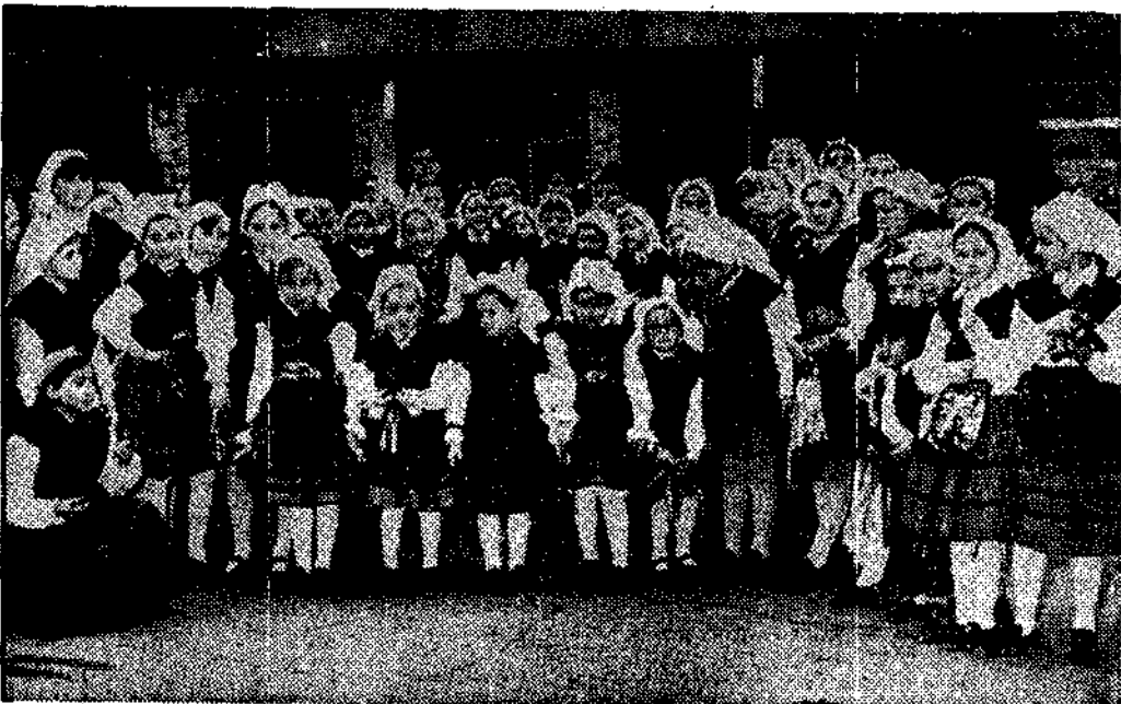
Muchos niños lucieron el traje regional. Y los mayores montera picona. La asturiania de la fiesta, su principal aliciente.

Todos los alumnos y alumnas matriculados en este centro para realizar el examen de una o dos asignaturas de cuarto y sexto, de la presente convocatoria extraordinaria de diciembre, que los referidos exámenes tendrán lugar en este centro el próximo día 5 de diciembre, cuya distribución y horario de las asignaturas se halla expuesto en el tablón de anuncios de este Instituto.