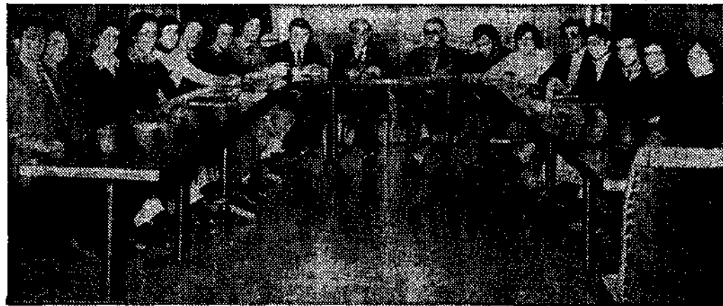
Asistieron trabajadores jóvenes de la provincia