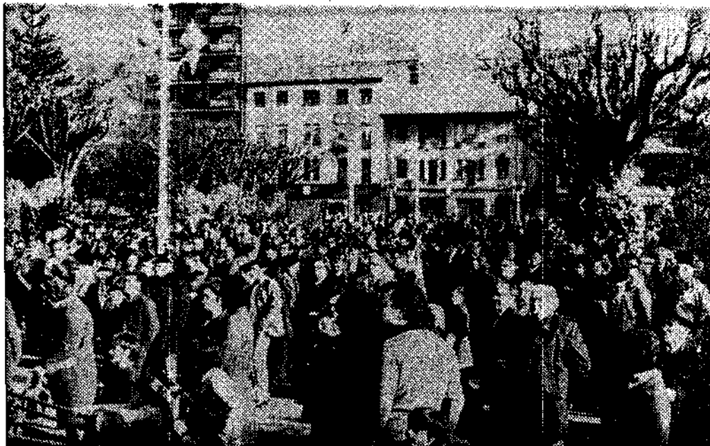
El éxito de la fiesta fue total: numerosa gente se congregó en el parque para escuchar el festival de asturiania.

Todo se sumó al éxito de la fiesta de San Andrés en El Entrego: la declaración de jornada local festiva con cierre de comercio y actividad; la suma festiva de «santa HUNOSA» que subraya ahora varios sábados al año; el tiempo, más que otoñal, primavera; un programa inteligente a base de mucha asturiania, niños con traje regional y montera picona en los