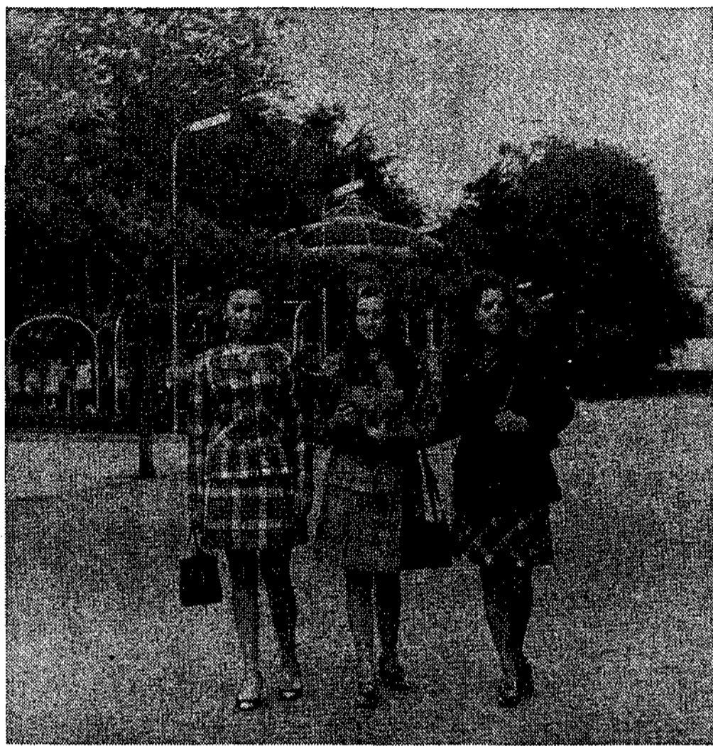
La reina y sus damas de honor.

Hoy, en Sama de Langreo, como nuestros lectores ya saben, tendrá lugar el acto de