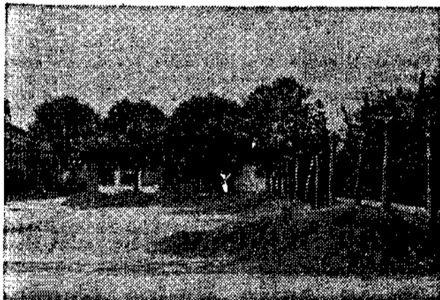
Este es el solar de la antigua plaza de El Entrego; necesita urbanización y acomplamiento al parque.

EL SOLAR DE LA ANTIGUA PLAZA DE EL ENTREGO PRECISA URBANIZACION