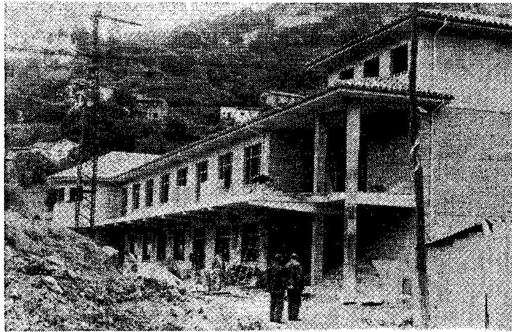
El nuevo establecimiento hotelero que se construye en la zona de San Vicente (El Entrego).

MAÑANA SE REANUDA EL CURSO DE AZAFATA DE HOSTELERIA