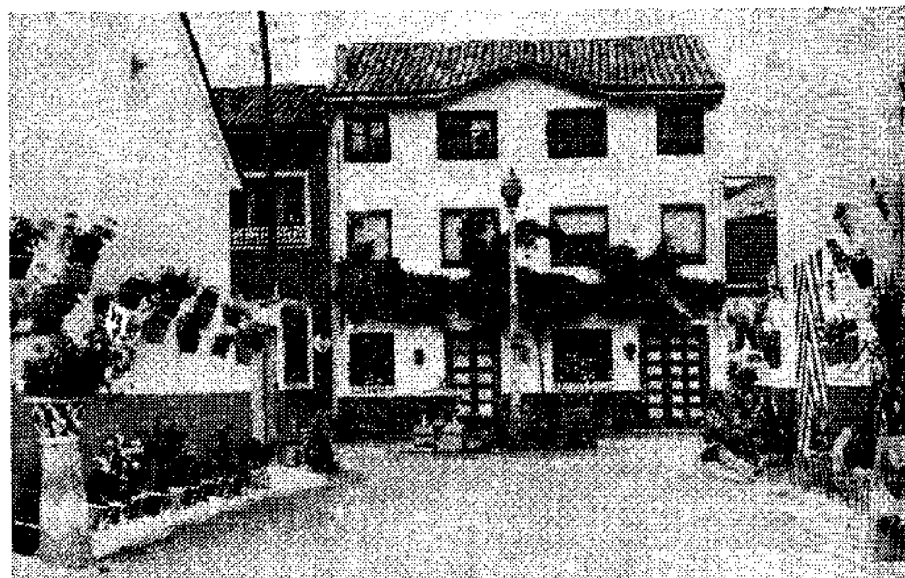
Un rincón del barrio Los Llerones, en Barros, que constituye muestra eloquente de la gran labor de embellecimiento que se lleva a cabo en el concejo.

Cuenta además con una terraza volada desde la que se disfruta una agradable vista especialmente cuando se completan las obras de este complejo que tiene previsto un magnífico parque infantil y una piscina en su parte frontal.