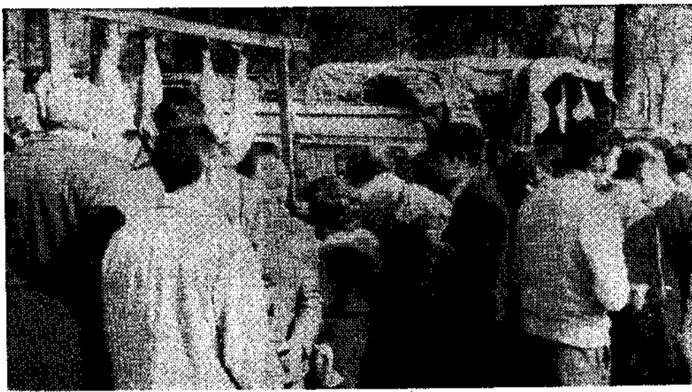
fiesta era general, con bailes y la algazara consiguiente. La «primera flor» fue algo insuperable, y con la esperanza de que cada vez contará con mayores adeptos y visitantes.

Toda la villa era una feria, con puestos de artículos de venta por todas partes, baratijas, barracas, semillas, hortalizas, aperos de labranza y altavoces. Claro que lo importante el pasado domingo era el ferial de los jamones, que alcanzó el grado sumo, para proclamarse como fiesta de interés turístico, puesto que a ella con-