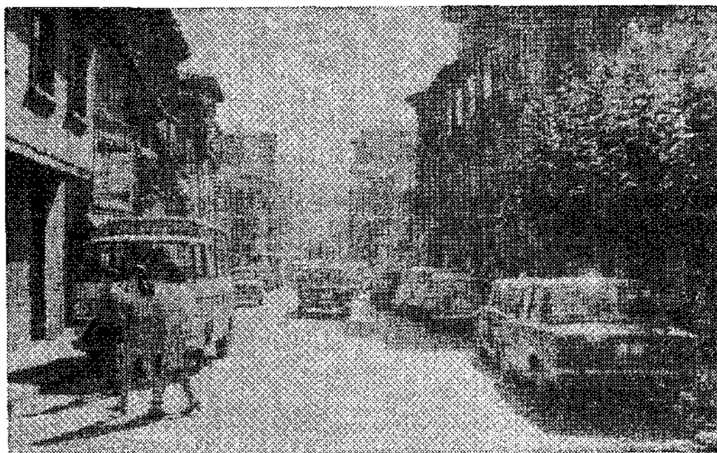
Una foto actual de la calle del Generalísimo,