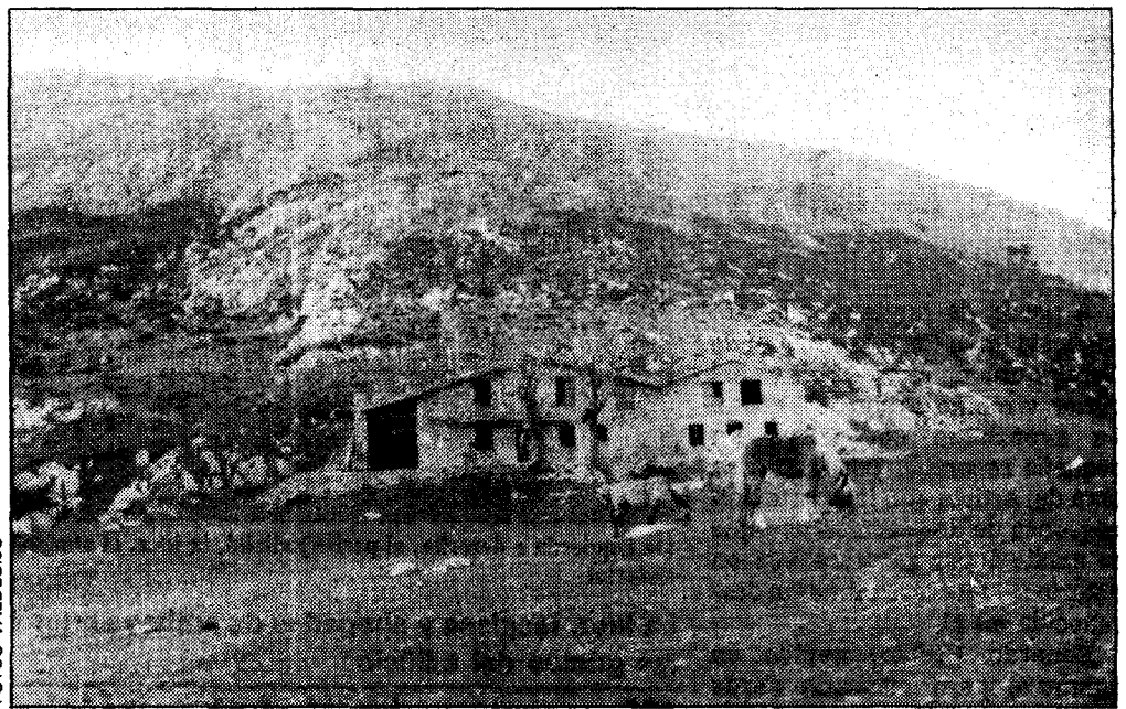
La campa de Breza: al fondo, un edificio capaz de albergar a treinta personas