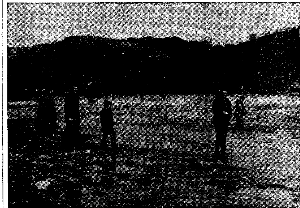
Las zonas libres están quedando cada vez más limitadas, mientras en los cotos no se amplía el número de permisos.