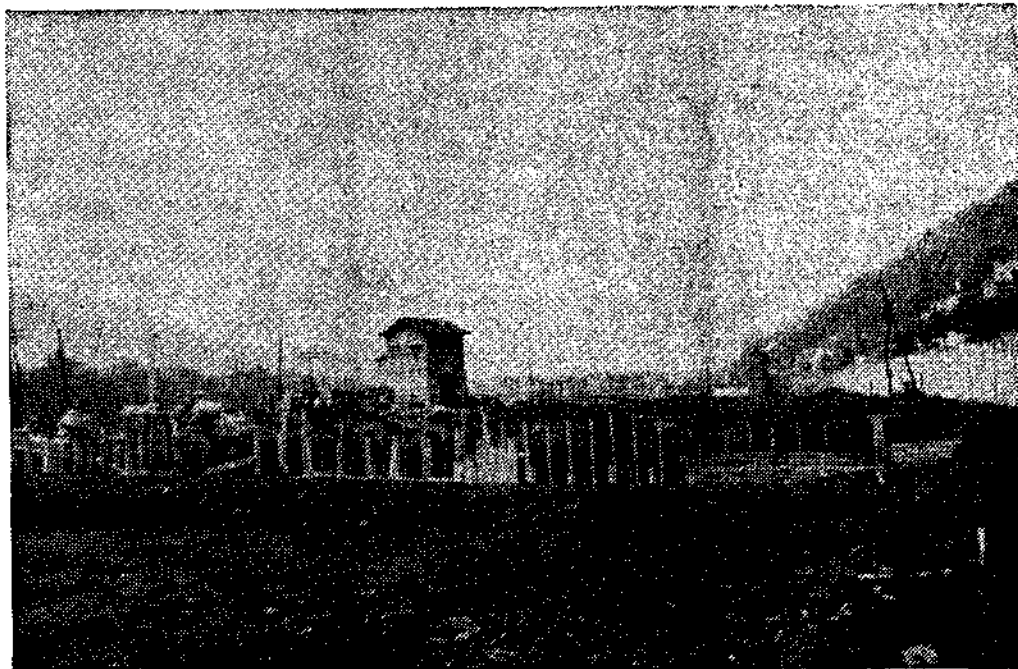
Es amplísimo el solar donde se ubicarán las instalaciones.

En nuestra visita a la zona donde se llevan a cabo los trabajos hemos tenido ocasión de cambiar impresiones con el encargado de la obra, el