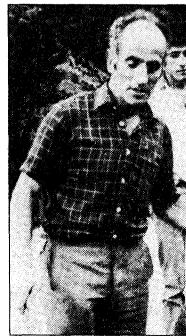
Uno de los representantes de los ganaderos de la zona alta

comienzo la llamada «guerra de los pastos», generada por la interpretación errónea de la palabra «pertenencia», la situación vino manteniéndose pacíficamente. Probablemente en aquellos años fue cuando surgió más número de cabezas de ganado y que se supone agotarían más rápidamente los pastizales. Argumentos que hoy día siguen manteniendo los ganaderos del