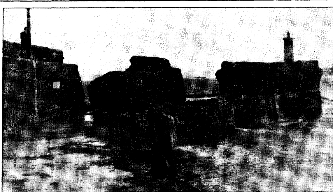
El temporal destruyó el muelle del Gayo

Los que quieran integrarse en cada una de estas voces, se pueden presentar en los locales de la Junta de Iniciativas de Caborana, los martes o viernes de ocho a diez de la tarde, que son los días de ensayo, donde recibirán la adecuada información. También se pueden poner en contacto con el director, el presidente o cualquier miembro del coro.