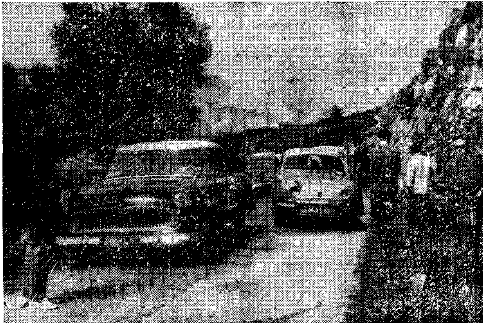
Mil quinientos vehículos...

Mil quinientos vehículos, entre autocares, camiones, automóviles y motocicletas, llegaron ayer por la mañana a la vega de Enol. Se trata, sin duda de ninguna clase, de la afluencia de gente más numerosa que se recuerda. El aspecto que ofrecía la carretera, sobre todo en algunos trechos, era impresionante. Considerado desde un punto de vista puramente espectacular daba sensación de carrera ciclista de gran altura, por la policromía de la interminable caravana.