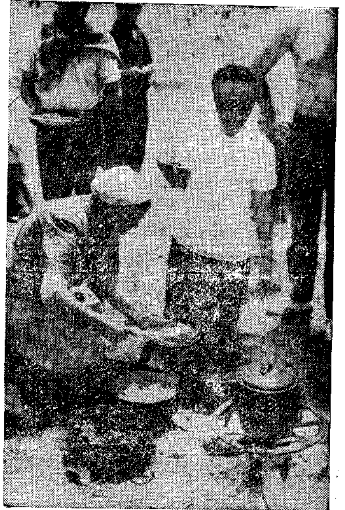
Llegó la hora de comer. La paella ya está a punto

La ordenación de la circulación comenzaba en Covadonga y terminaba a la entrada de la vega de Enol, donde, donde las dificultades se acrecentaban enormemente. Pero la actuación de la Guardia Civil de carretera no se limitó a la ordenación del tráfico, sino que se extendió también, como se puede ver en la fotografía, a un eficaz servicio de asistencia técnica. No se pueden regatear elogios, por lo tanto, para estos hombres que estuvieron en todas partes, que actuaron con gran eficacia y con indudable corrección en todo momento. Llegaron incluso a contabilizar el número de vehículos que subieron y bajaron, con fines estadísti-