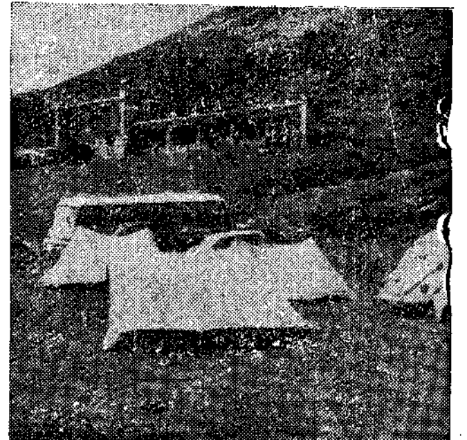
Los alojamientos resultaron insuficientes

Un elevado porcentaje de automóviles, llevaba matrícula extranjera, predominando la francesa.