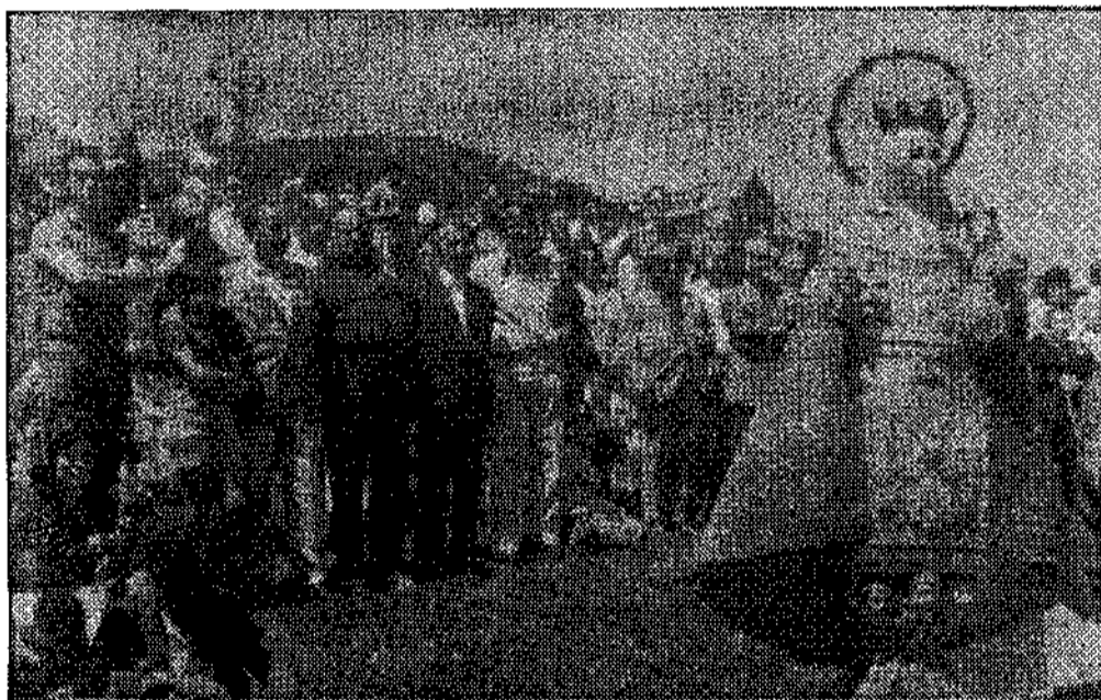
La Virgen de Covadonga preside esta singular romería asturiana.

de Educación y Descanso del vecino pueblo de Sotondio, cuyos nombres no reseñamos por ser sobradamente conocidos. A ellos se debe esta gran realidad, esta típica fiesta de asturiana sin límites.