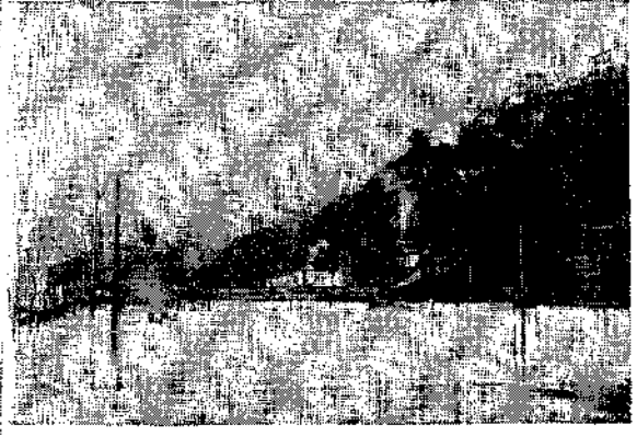
Esta es la pista Santiago; su aspecto exterior es deprimente.