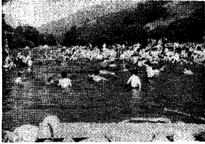
(De nuestro corresponsal, Luis CALLEJA OCHOA).

ADEMAS DEL PROYECTADO DE COLLANZO, TAMBIEN SE PODRIA CONSTRUIR UN PARQUE SINDICAL EN OYANCO