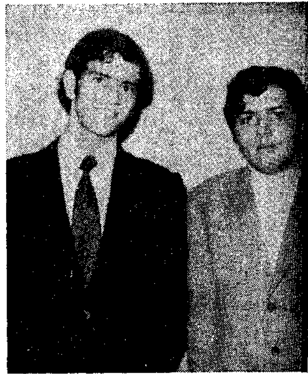
Los ganadores del concurso