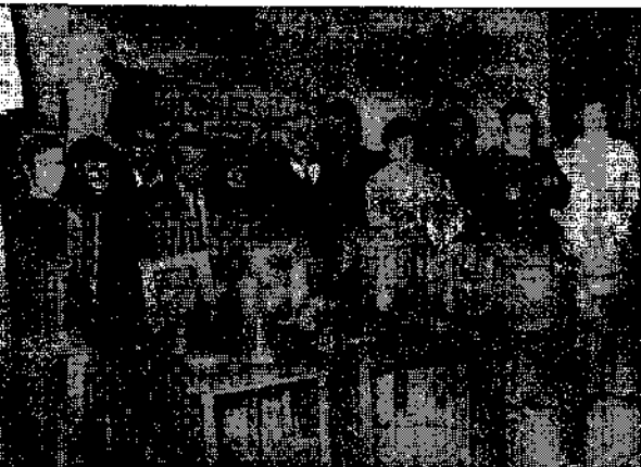
Curso de fontanería