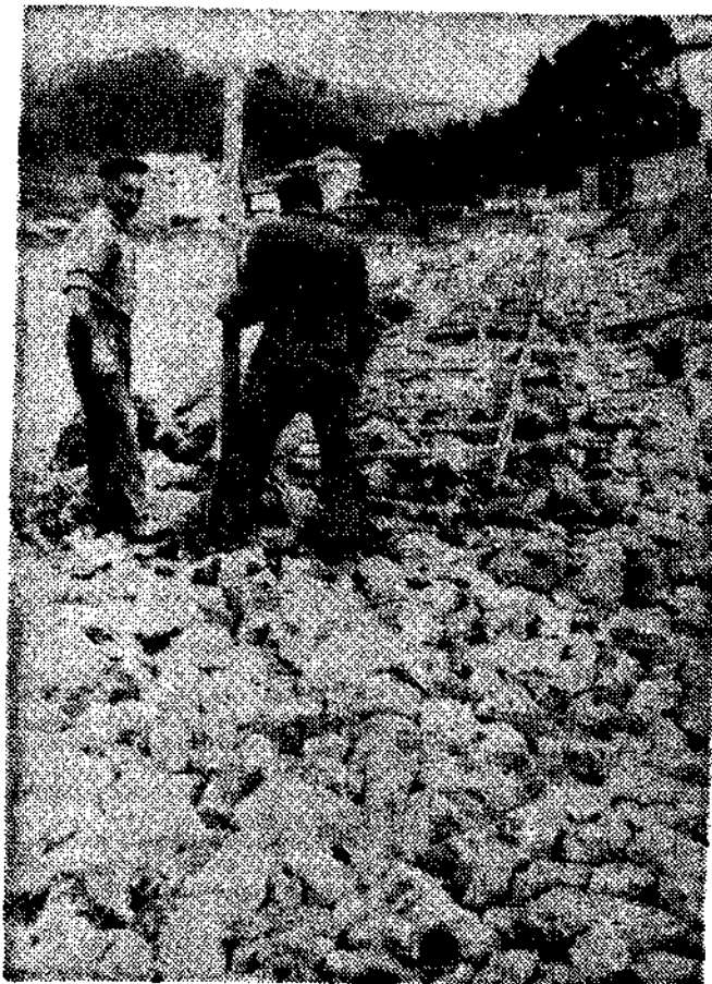
Preparación de la escollera