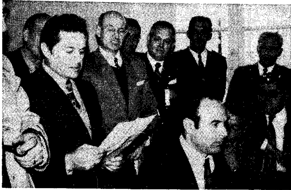
Preocupación por la enseñanza

EL GOBERNADOR DECLINO LA ACEPTACION DE LA MEDALLA DE ORO DE LA VILLA