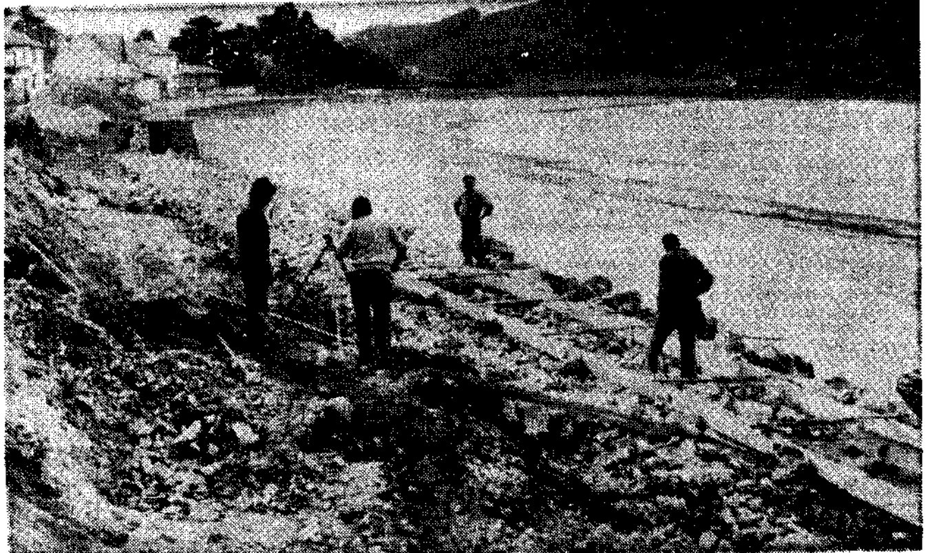
Obras en la playa

hundió la draga que se dirigía a limpiar el puerto, operación que antes se realizaba cada dos años y ahora pasan diez. Ha sido éste el tema más candente de la reunión. El gobernador dijo que era preciso reconocer que sobran puertos en España. No se trata de mantener moribundos, hay que hacer inversiones, no