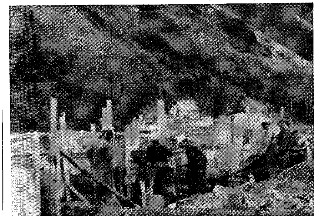
Trabajando durante el tiempo que los demás dedican al descanso.