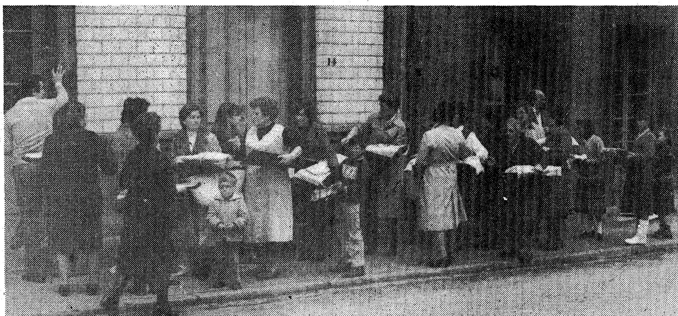
A pesar de la lluvia hubo lleno en la Pola

Fábrica de bisutería y artículos de regalo solicita representante libre a comisión para Asturias, León y Santander. Enviar curriculum vitae con foto reciente y teléfono para posible contacto a CREACIONES CHAS. Rivero, 65, bajo. AVILES