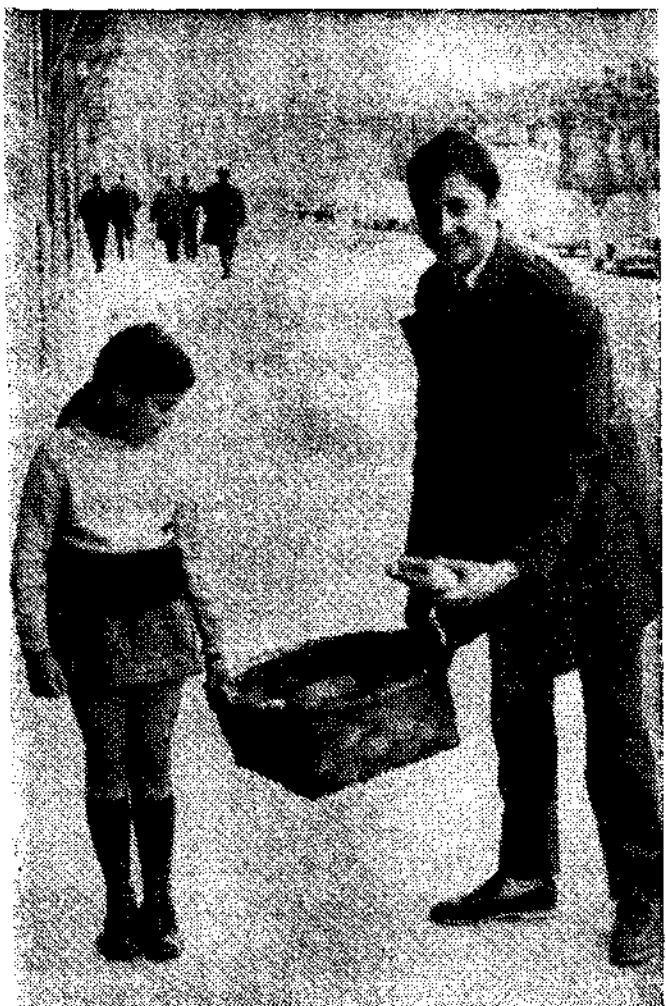
Todos los poleosos del mundo han recordado la fiesta de «les comadres». Se abre la veda de las fiestas en Pola de Siero... la villa de las fiestas de mucho ringo rango. AVELLO

—No está mal. Los poleosos, fieles con sus