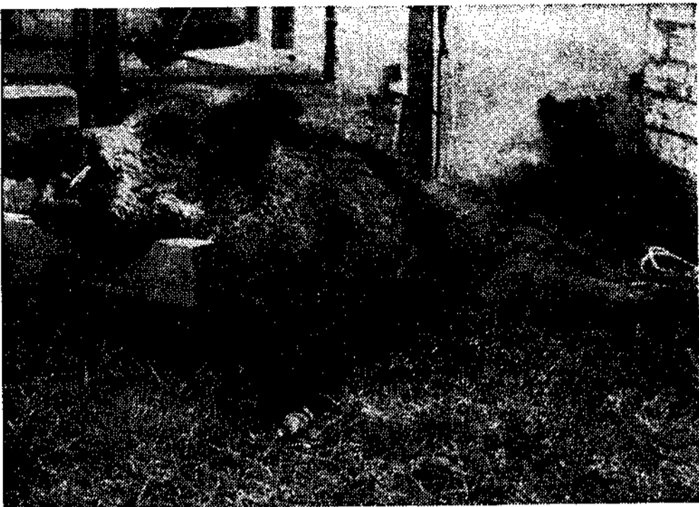
El magnífico ejemplar de 116,700 kilogramos