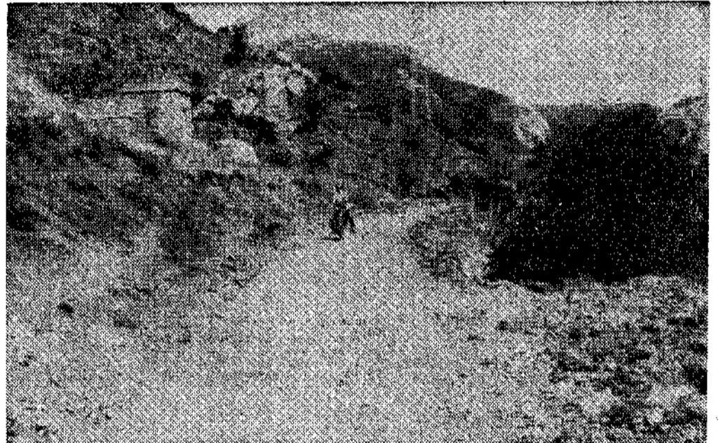
Comienzo de la carretera

Pero ahora, el pueblo de Pinos, sin decir nada a nadie,