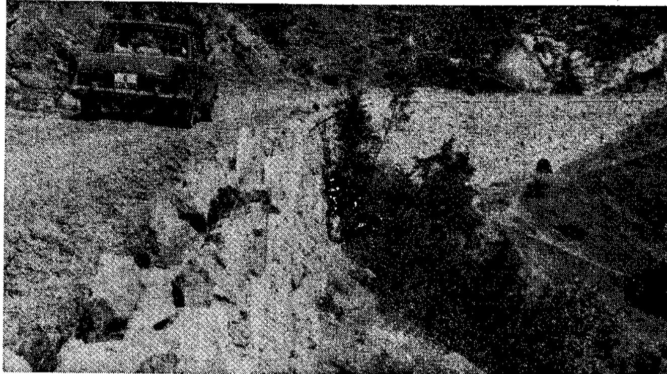
Un coche circulando por la carretera

LAS OBRAS ESTABAN PARADAS DESDE 1942, CUANDO FALTABAN DOS KILOMETROS PARA FINALIZAR LA OBRA