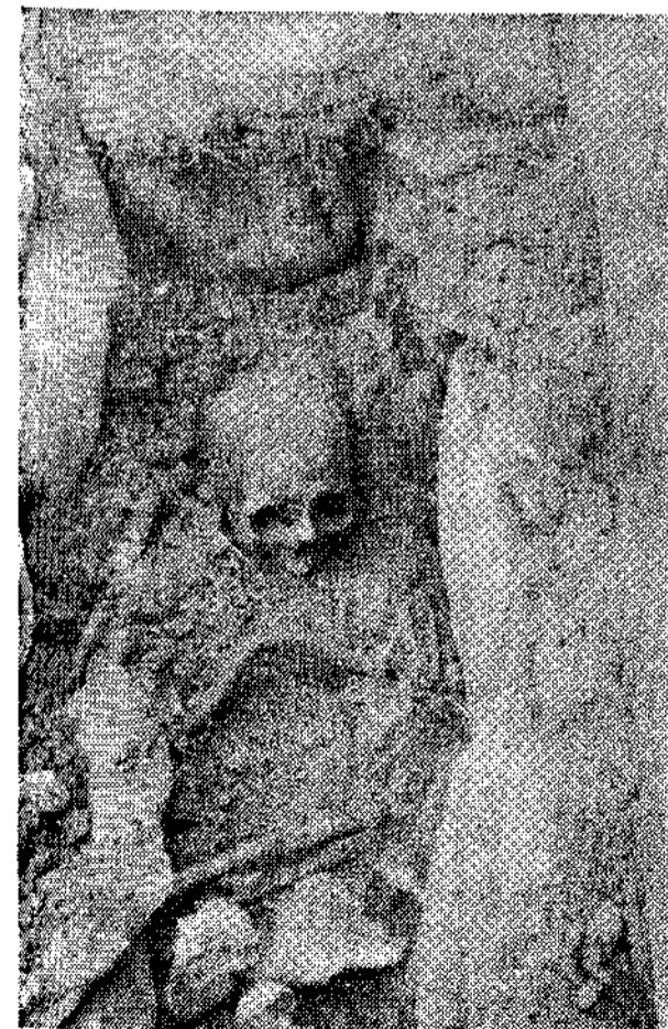
Plano de la sepultura.