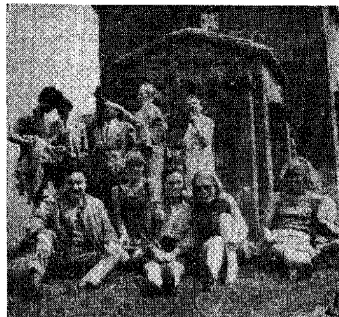
Los componentes del grupo de alumnos del Instituto de Historia del Arte de Amsterdam, acompañados del alcalde de Lena. Al fondo, la ermita de Santa Cristina.

Pola de Lena. — (De nuestro corresponsal interino, N. R.).