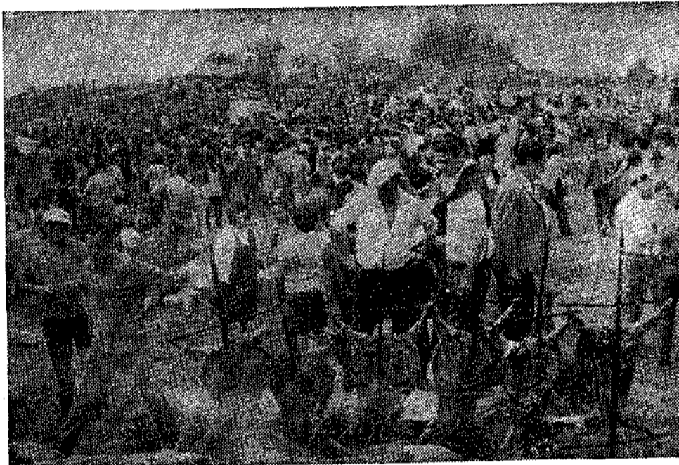
Media docena de corderos que se están poniendo a «punto»

hación por las dos del quinto año de bachiller, están pasando varios días en esta villa.