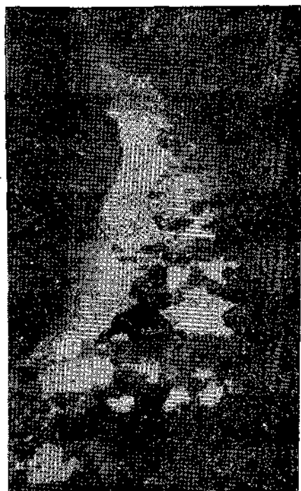
Así está el acceso a San Martino.

ma causa, taponó el acceso desde la vega de Villallana. La ausencia en este de curatas, hacen que cualquier lluvia que dure más de dos o tres horas, convierta el caudal que recoge los afluentes de las cotas que hay a los lados. Por otra parte, el camino llamado "El Calejón" que va desde San Martino a Villallana está totalmente tupidado por la maleza, las argomas, los artos y, también por tratarse de un camino muy pendiente, es torren-