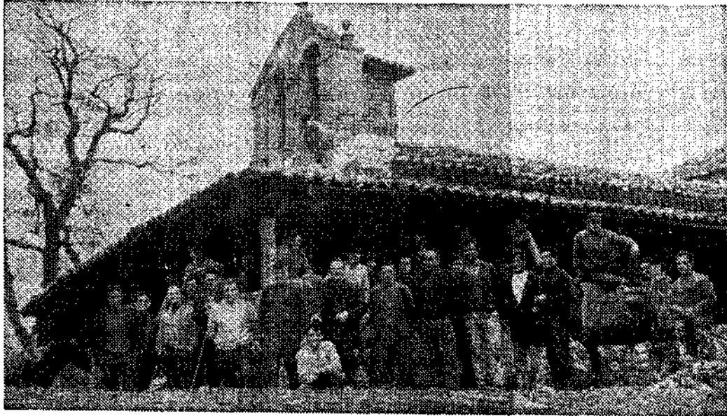
Parte de los vecinos que intervinieron en los trabajos

Más adelante puede hallarse en el referido libro detalles que denotan la importancia