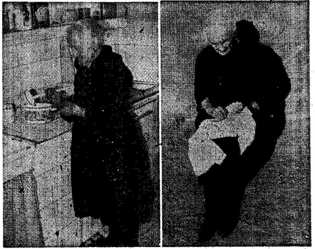
VIVE SOLA Y HACE TODAS LAS LABORES DE LA CASA