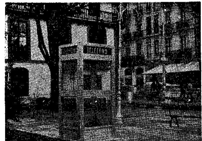
Cabina telefonica en Navia.