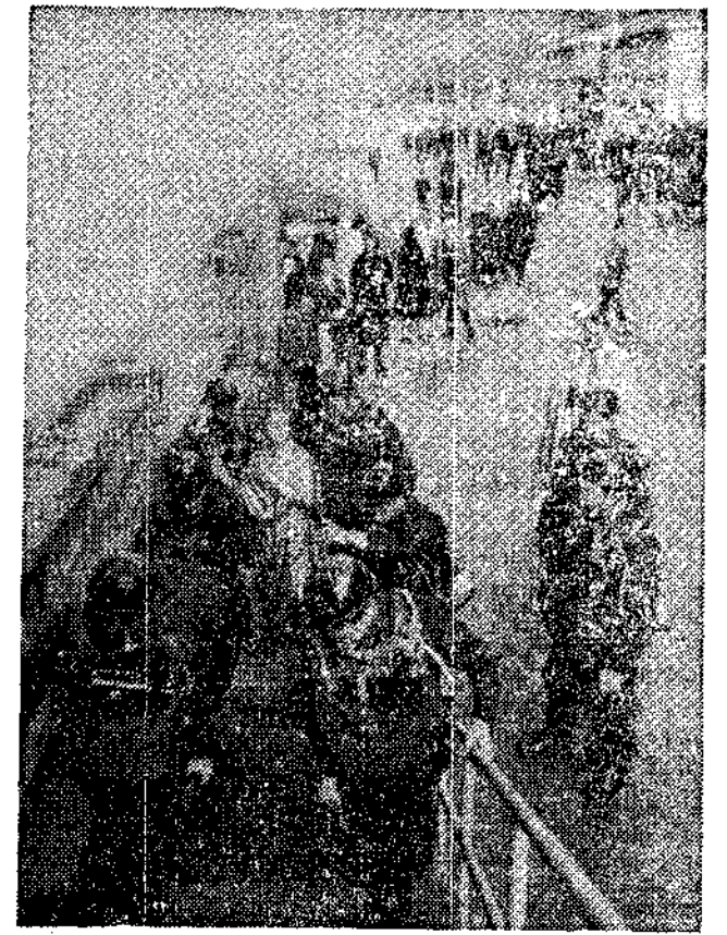
Los mineros y la Patrona Santa Bárbara.

Morcín.—Mañana viernes, festividad de Santa Bárbara, serán muchos los mineros que se congreguen al pie de los castilletes para celebrar su día y honrar a la Patrona de la minería.