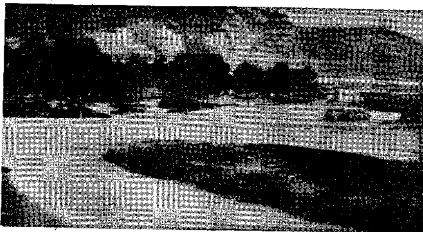
La concesión de enclapitos, por noventa y nueve años

Quando el verano se acaba y ahora que estamos a tiempo, es el momento de reconsiderar situaciones. Una de nuestras playas y polos turísticos. Bueno será prevenir para curar en salud y subsanar las deficiencias observadas este año. La ría de Villaviciosa o, más concretamente, su entorno, el triángulo Rodiles-Punta-Misiego, es una de nuestras principales fuentes y a la vez reservas turísticas; por ello, nos hemos decidido a hacerla objeto de nuestro sondeo preventivo, en la esperanza de que el breve plazo de que se dispone para corregir los defectos y problemas que tiene planteados, sea aprovechado al máximo, merced a esta pronta llamada de atención.