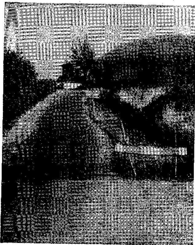
La inacabada carretera