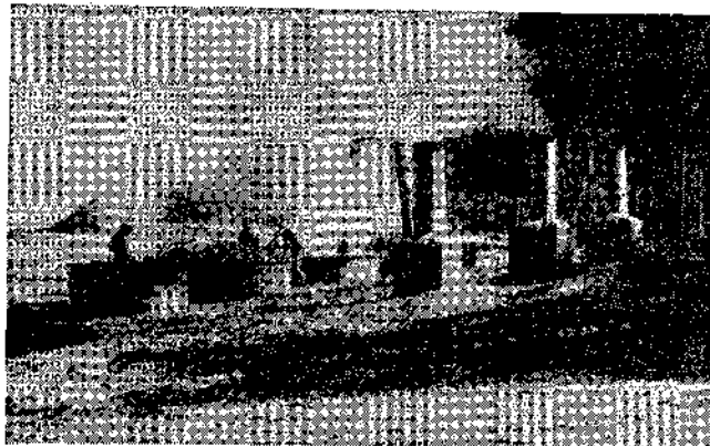
Una "industria" sobre la playa

En definitiva, estos son los problemas y las ilusiones, las esperanzas, de una bella zona de Asturias. Esperemos que lo que aquí hemos planteado, contribuya a que el próximo año sea aún más bella si cabe. Una buena ordenación y un drenaje de la ría, pueden hacer de la misma un puerto descriptivo de primer orden. Esperemos también que un viejo proyecto de ANA de convertir la ría en reserva ornitológica no haya caído en saco roto. Si una de estas cosas que hemos planteado es tomada en cuenta, para el próximo año, nos damos por satisfechos.