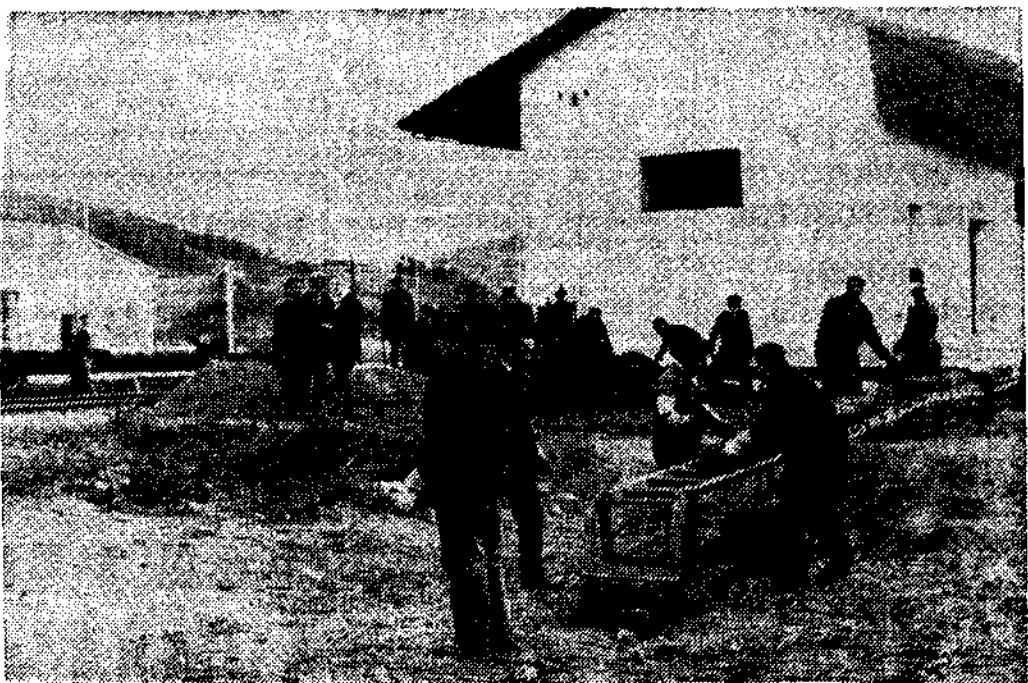
Vista parcial de los trabajos en la estación de Vegadeo

Las fotografías de Gudín que ilustran este reportaje son fiel reflejo de cuanto decimos.