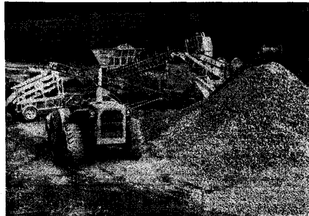
Potentes máquinas trituran la piedra para la vía

En principio se realizará la superestructura hasta Tol (Castropol)