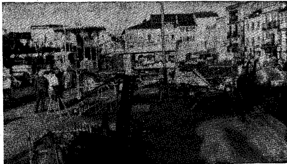
Exposición de maquinaria agrícola