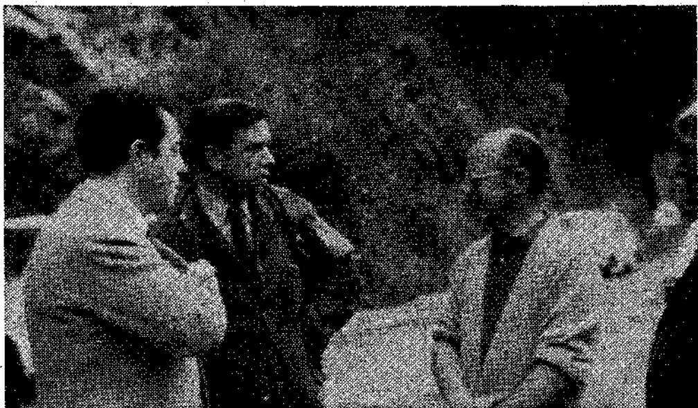
El ministro de Hacienda conversa con el gobernador civil y con el presidente de la Diputación.

Aunque las aguas del Cares bajaban empañadas, la insistencia del ilustre político obtuvo su fruto. Tras la captura de un sal-