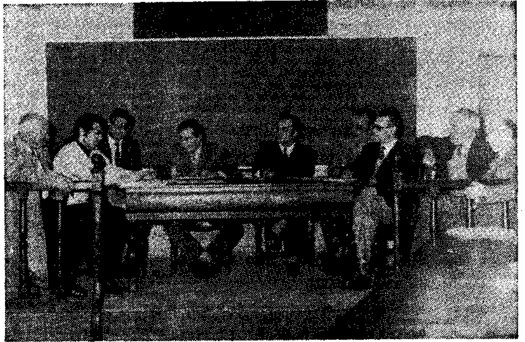
Presidencia de la reunión celebrada para programación de obras de desarrollo comunitario

Acondicionamiento y pavimentación de camino de acceso al pueblo, con un presupuesto estimado de pesetas 200.000, a satisfacer por mitad entre el IRYDA y Ayuntamiento y vecinos.